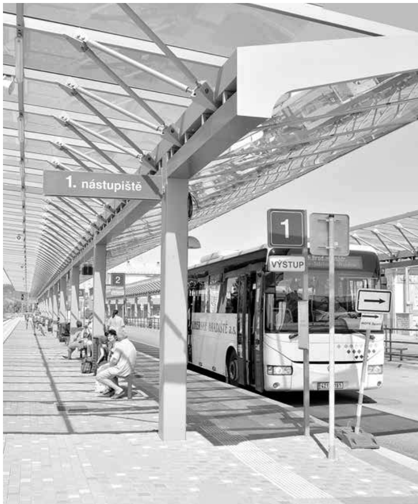
První část nového dopravního terminálu už slouží cestujícím.

Nový terminál bude provozovat společnost ČSAD Uherské Hradiště. Jak naloží s nádražím z roku 1986, na to zatím jasná odpověď chybí. Dopravní společnost se areál zatím pokouší prodat prostřednictvím realitní kanceláře. „Exkluzivně Vám nabízíme k prodeji areál autobusového nádraží v Uherském Brodě,“ uvádí kancelář ve své internetové nabídce s tím, že cena za 9 318 metrů čtverečních je neveřejná a předpokládané uvolnění areálu bude k 1. únoru 2016. JAROSLAV CHUDARA