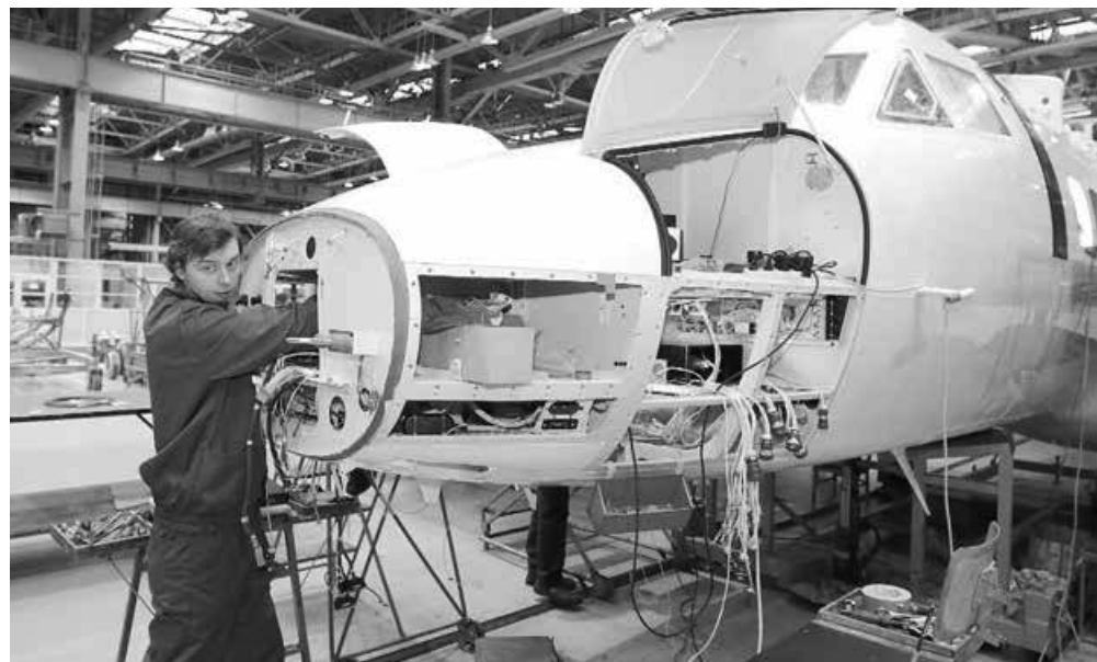
Kunovická společnost je stále jedním z největších zaměstnavatelů na Uherskohradištsku.

Do ztracena zatím vyznívá snaha úřadu práce o rekvalifikaci. „Při zadání veřejné zakázky jsme měli požadavek na výběr dodavatele, který zajistí rekvalifikační kurzy v oblasti letecké výroby - klempíř strojní a klempíř dražka. Jenže do výběrového řízení