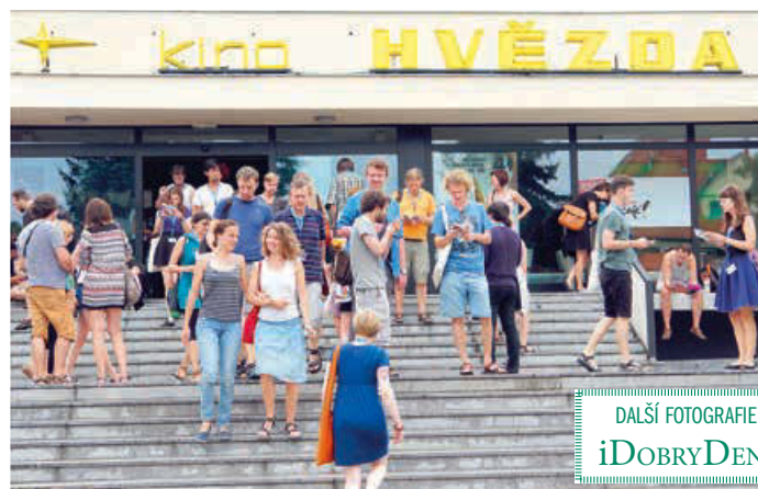
DALŠÍ FOTOGRAFIE NA iDOBRYDEN.CZ