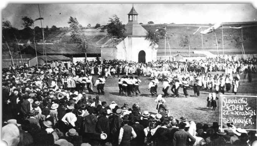
Slovácký den v Uherském Hradišti 5. července 1922 pod mařatickými kopci.