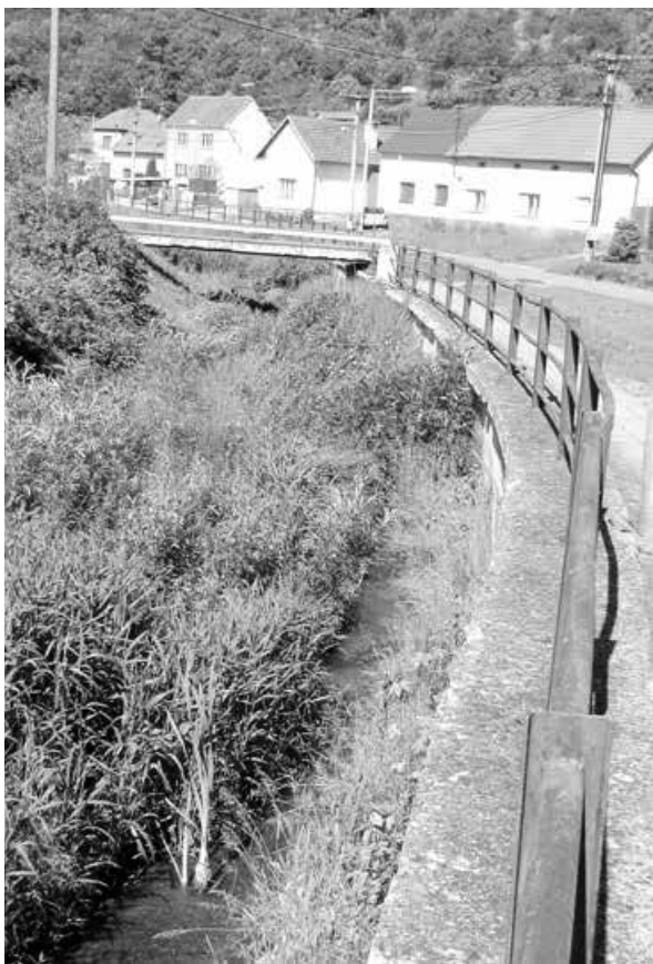
Kde je voda? Koryto Holomně dusí kromě sucha i náletové dřeviny.

Práce má provést luhačovičská Správa toků - oblast povodí Moravy, která patří pod křídla Lesů ČR. Podle původních odhadů si náklady vyžádají na 300 tisíc korun. Čištění podle projektu, který vznikl už v roce 2013, bylo v plánu už loni. Avšak práce dosud nezačaly kvůli nedostatku peněz, chybějící ploše pro uložení nánosů a také neochotě některých majitelů pustit na své