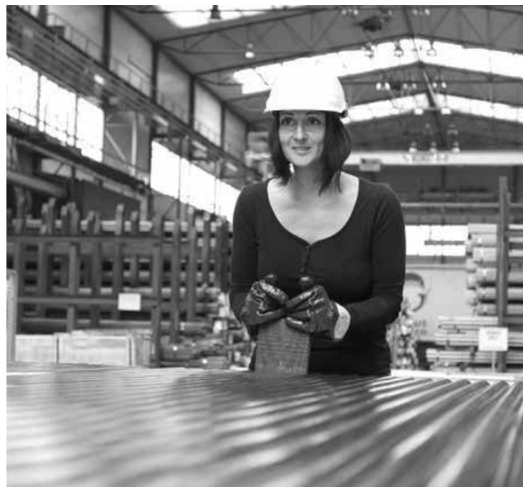
Kromě tažců hledají v tažárně oceli ve St. Městě i rovnáče a frézáře.