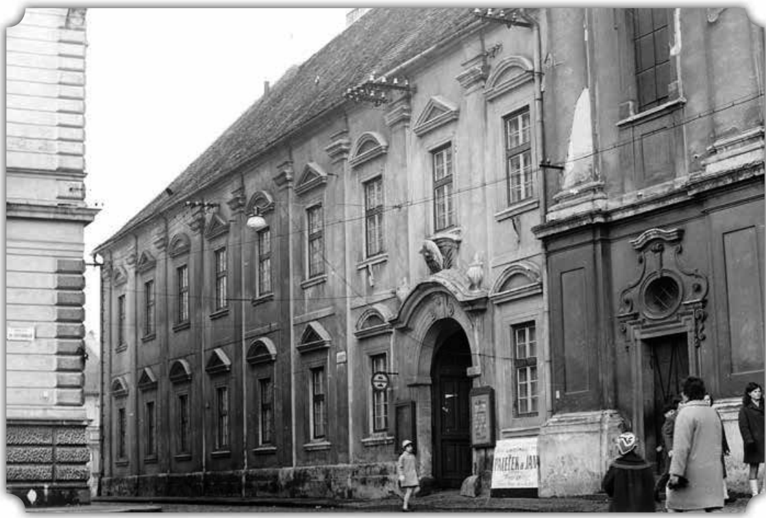
Čelní pohled na budovu Reduty z roku 1965.