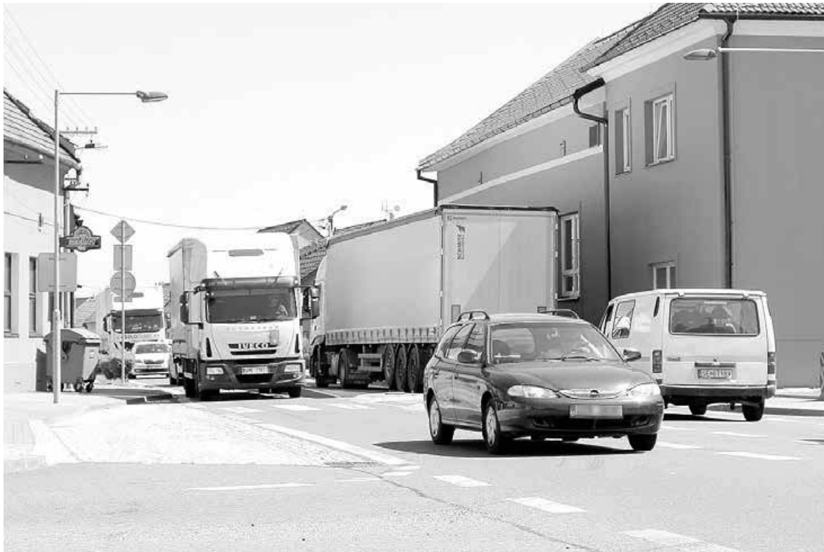
Každodenní obrázek z přetížené mezinárodní silnice I/55... Snímek je z Huštěnovic.

„Po schválení technicko-ekonomické studie na ministerstvu dopravy už nic nebrání pokračování přípravy jednotlivých staveb