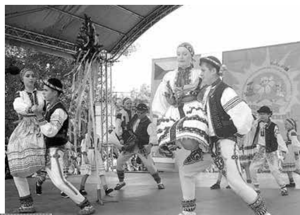
DALŠÍ FOTOGRAFIE NA iDOBRYDEN.CZ