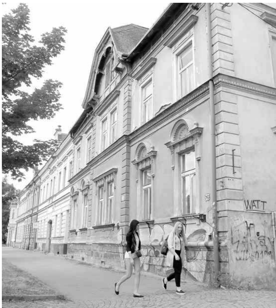
Opuštěný dům na Malinovského třídě v Uherském Hradišti je na prodej. Konkrétní záměr, který se lidem nejspíš nebude příliš líbit, má místní Charita. Nejráději by tam nastěhovala lidé bez stálé střechy nad hlavou.