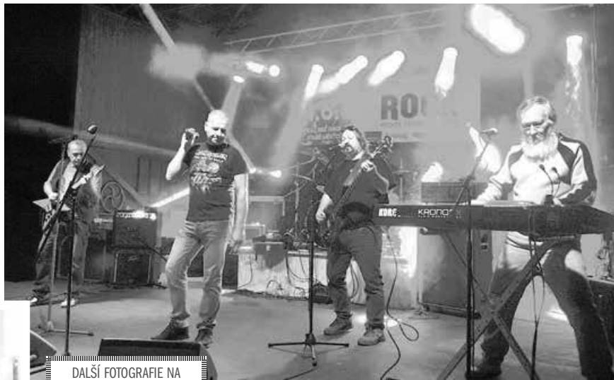
DALŠÍ FOTOGRAFIE NA iDOBRYDEN.CZ