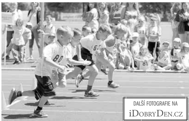
DALŠÍ FOTOGRAFIE NA iDOBRYDEN.CZ