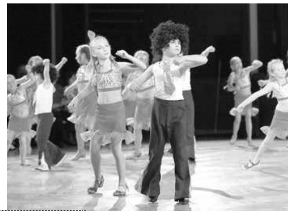
DALŠÍ FOTOGRAFIE NA iDOBRYDEN.CZ