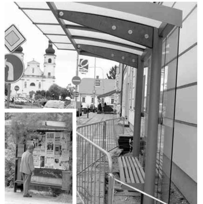
Nové zastávky budou zastřešené a bezbariérové.