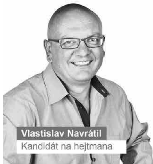
Vlastislav Navrátil Kandidát na hejtmana