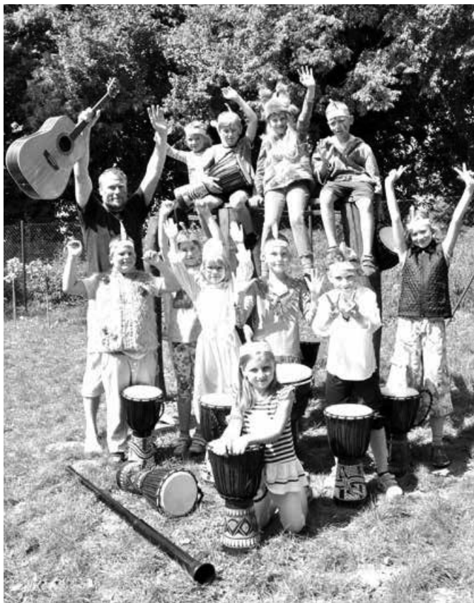
Tradičně oblíbený tábor s hudbou.

Táborníci nahlédnou do redakce DOBRÉHO DNE, televize TVS i zlínského regionálního rádia