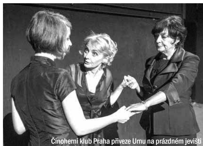
Činoherní klub Praha přiveze Urnu na prázdném jevišti

Oceněn bude i nejlepší původní text české divadelní hry. Anonymní soutěž o nejlepší původní divadelní hru vyhláší už třetím rokem divadelní a literární agentura Aura-Pont v návaznosti na 22 ročníků dnes už neexistující soutěže o Cenu Alfréda Radoka. Otevřena je všem novými českými nebo slovensky psaným hrám.