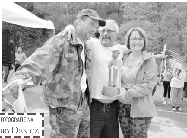
DALŠÍ FOTOGRAFIE NA iDOBRYDEN.CZ