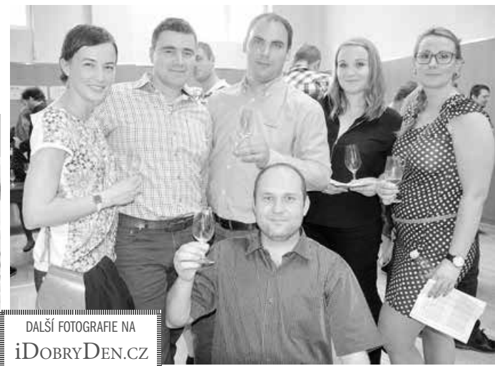
DALŠÍ FOTOGRAFIE NA iDOBRYDEN.CZ