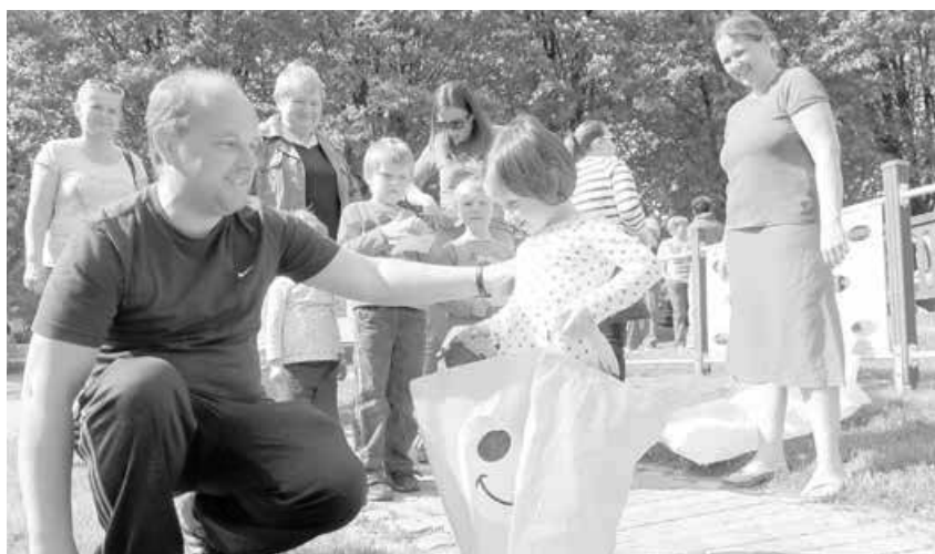
Nové hřiště v Buchlovicích mohou využívat děti i dospělí. Městyš za novinku zaplatil bezmála 1,4 milionu korun.

Jeho aktuální podoba potěší děti od 3 do 15 let, k dispozici mají hrad se skluzavkami, malé hřiště s umělým